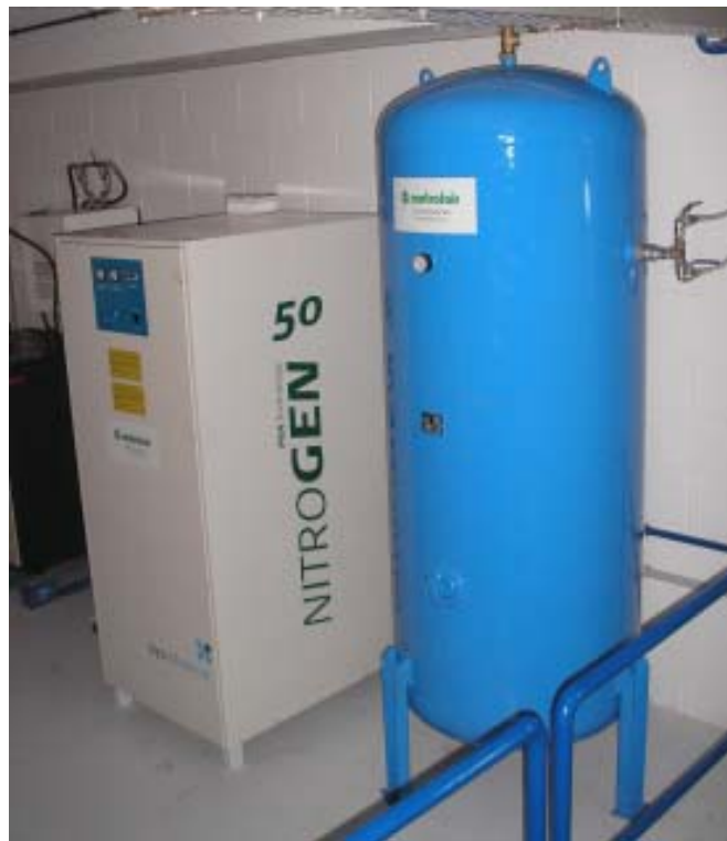
(Instalación de Elson Electrónica)